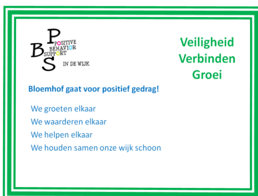
Figuur 2 en 3. Voorbeelden vertalen naar gedrag en beelden voor wijk Bloemhof en Crooswijk

Als de wijkwaarden zijn vastgesteld, dan kan de volgende inhoudelijke PBS-stap in het implementatietraject worden gezet, het vertalen van waarden naar concrete gedragsverwachtingen. Immers: hoe duidelijker wij als volwassenen in positieve, concrete, gedragsmatige termen aangeven welk gedrag wij van kinderen en jongeren verwachten, hoe groter de kans is dat zij hieraan kunnen en zullen voldoen. Het PBS IN DE WIJK kernteam formuleert gedragsverwachtingen voor de wijk en de verschillende PBS teams van de afzonderlijke organisaties formuleren gedragsverwachtingen voor hun eigen organisaties. In Figuur 2 staat een voorbeeld van gedragsverwachtingen die zijn vastgesteld in de Rotterdamse wijk Bloemhof.