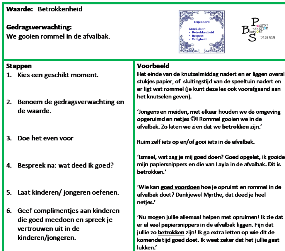
Figuur 4. Les in goed gedrag

Op wijkniveau valt verder op dat rondom het onderwerp ‘gedrag actief aanleren’ veel behoefte is aan het uitwisselen van gedachten over het belang en de functie van het positief model staan door de volwassenen in de wijk. Er wordt tijdens bijeenkomsten regelmatig besproken hoe de volwassenen in de wijk de waarden en gedragsverwachtingen die zijn vastgesteld zelf uitdragen, wat daarin makkelijk is en waar uitdagingen liggen. Ook worden er concrete doelen gesteld, zoals: ‘de komende week groeten we ieder kind/ iedere jongere die we op straat tegenkomen en letten we op het effect. Bij de volgende bijeenkomst evalueren we wat dit oplevert’. Door het positief voorleven, een belangrijke stap in het aanleren van gedrag, regelmatig als thema terug te laten keren bij de verschillende PBS IN DE WIJK bijeenkomsten, neemt het bewustzijn over onze belangrijke rol hierin als volwassenen toe, evenals het aantal volwassenen dat hiermee actief aan de slag gaat.