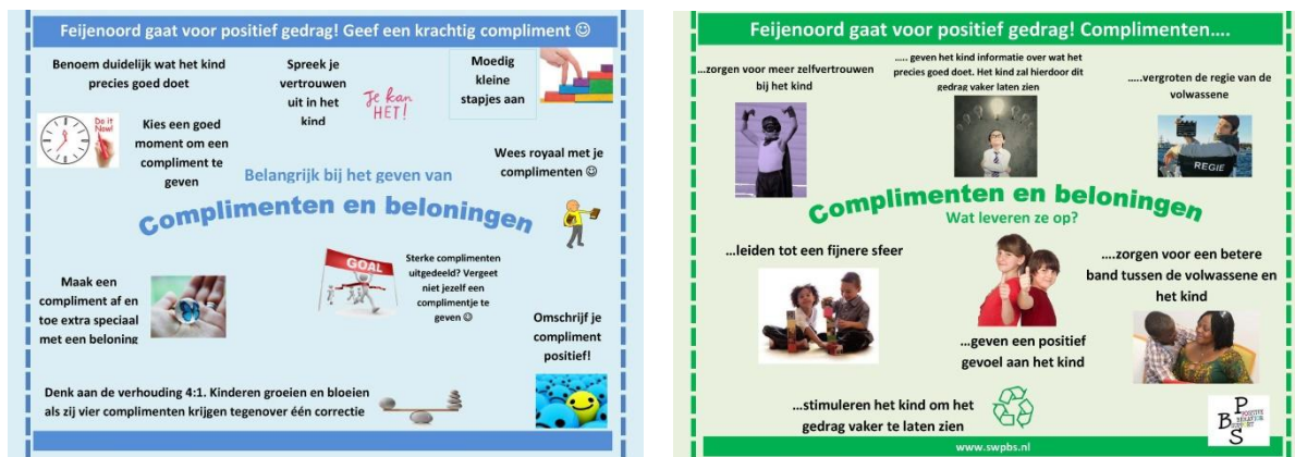
Figuur 5 en 6.

praatplaten over het belang en de functie van complimenten geven. Dit zijn voorbeelden van materialen die aan bijvoorbeeld ouders kunnen worden uitgedeeld.